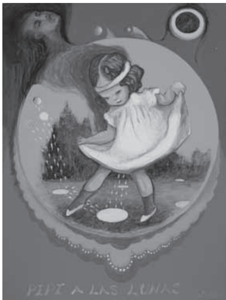
Sin título • CAT 2