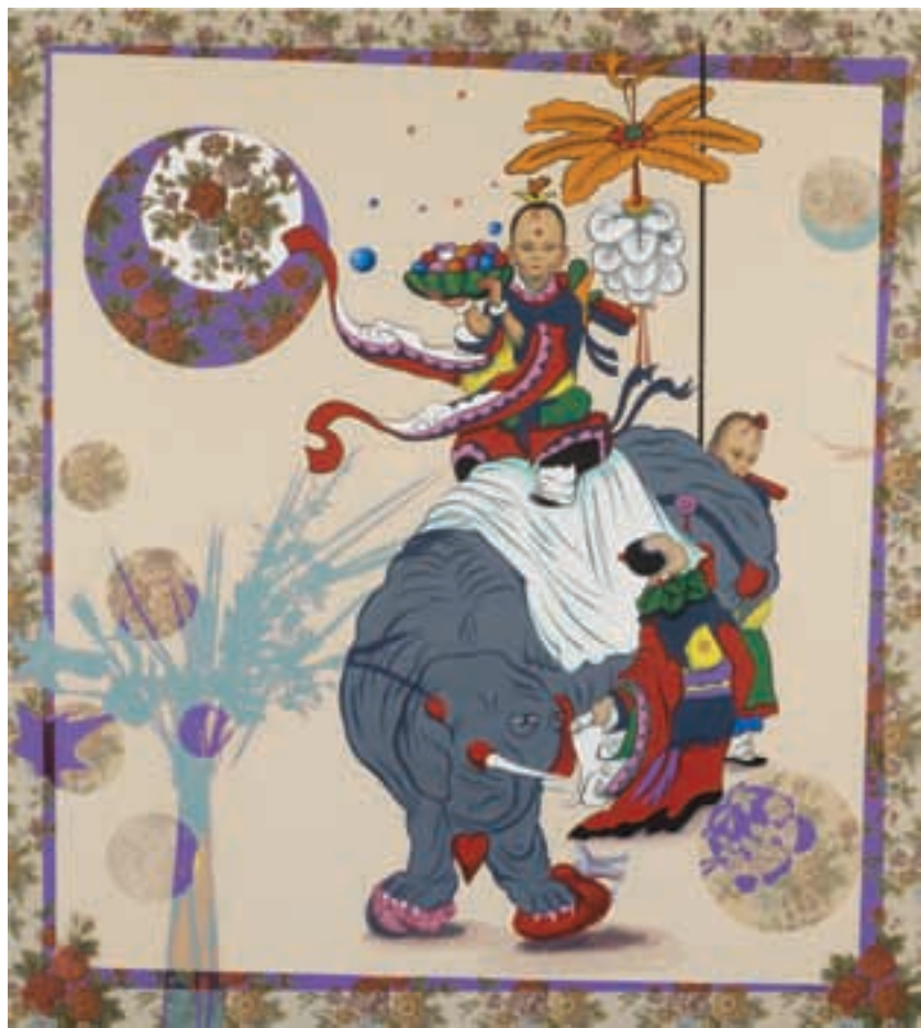
Sobrepesada sombra de trompa y tiempo • CAT 4