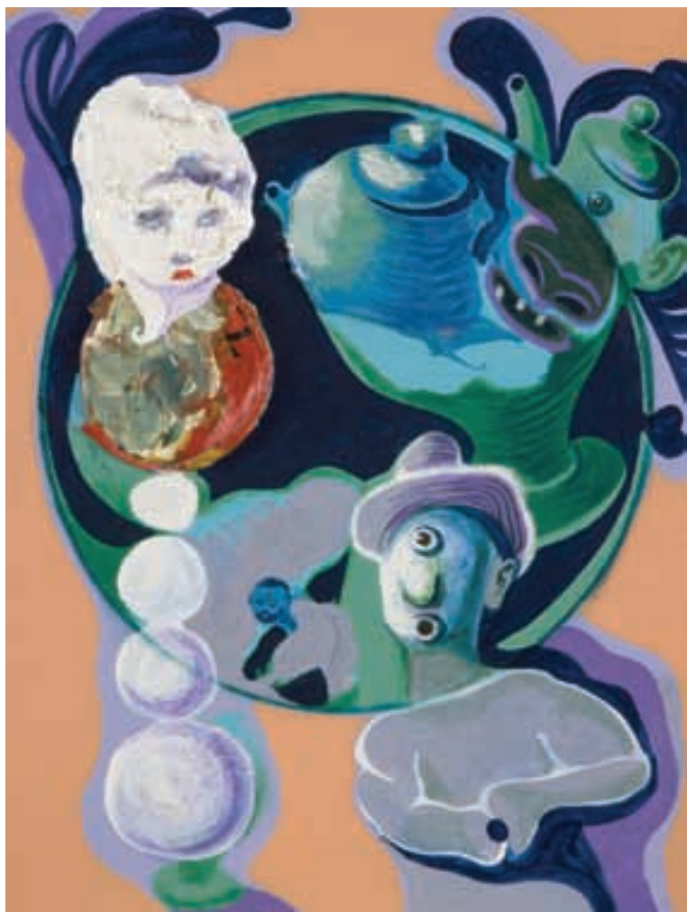
Sin título • CAT 12