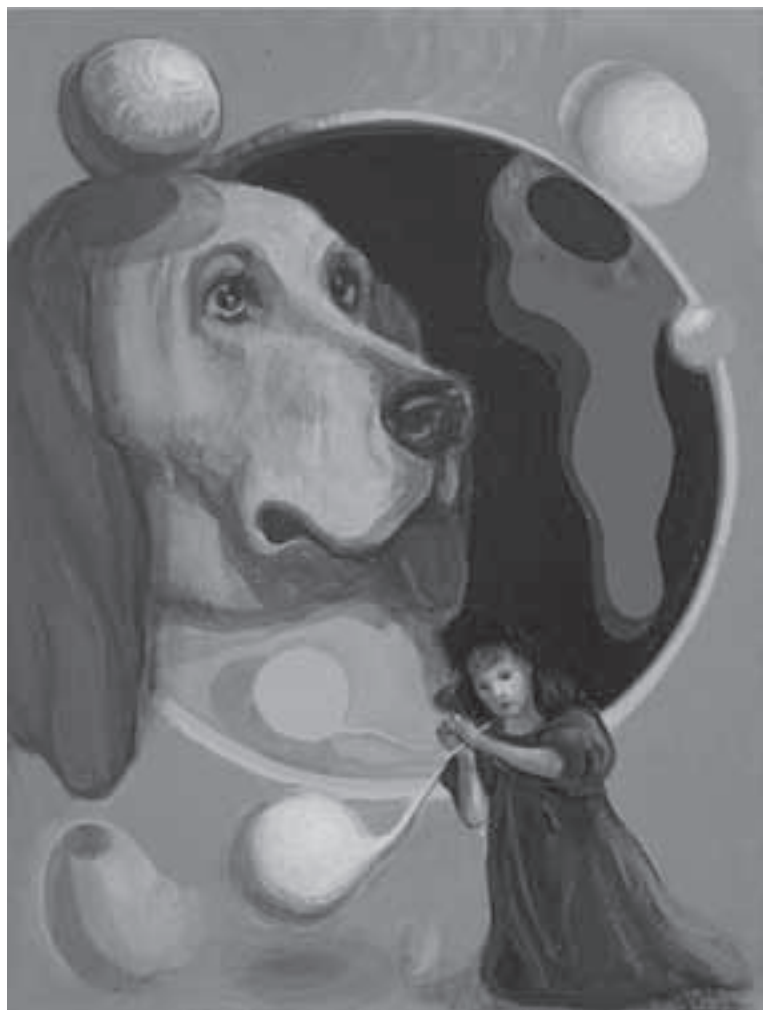
Sin título • CAT 1