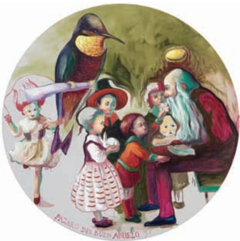
Pájaro del buen abuelo (agüero) • CAT 7