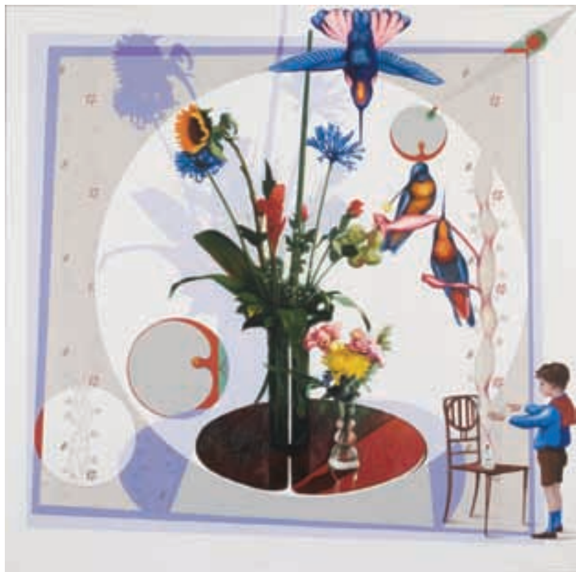
Encanto de las edades. Trece punto cero, diez veintitrés • CAT 3