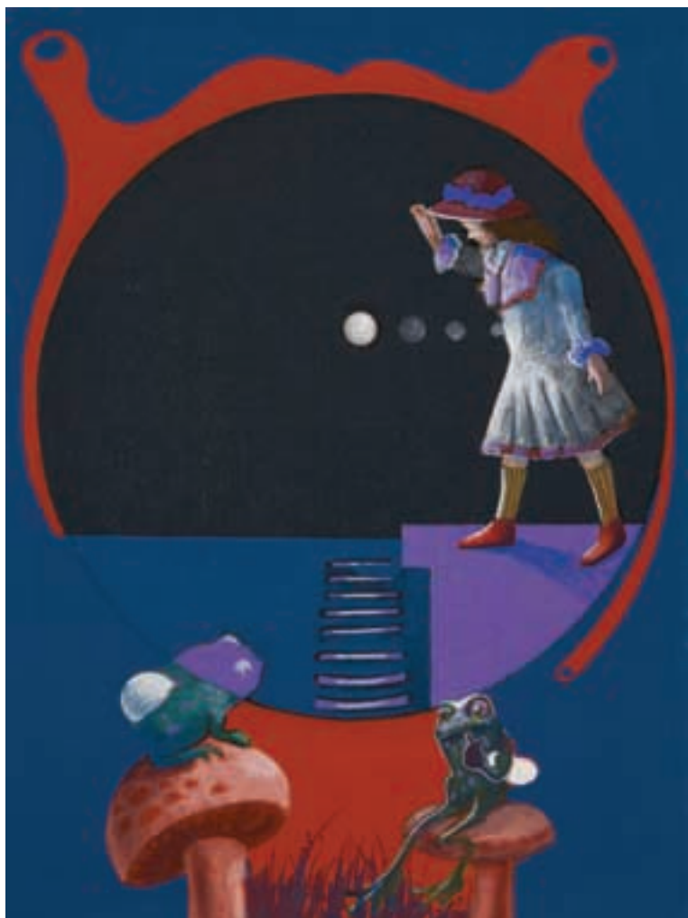
Sin título • CAT 11