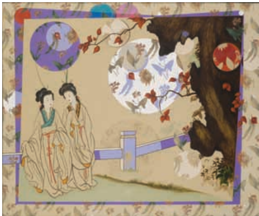
Paisaje orientalmente cerca de las sombras • CAT 9