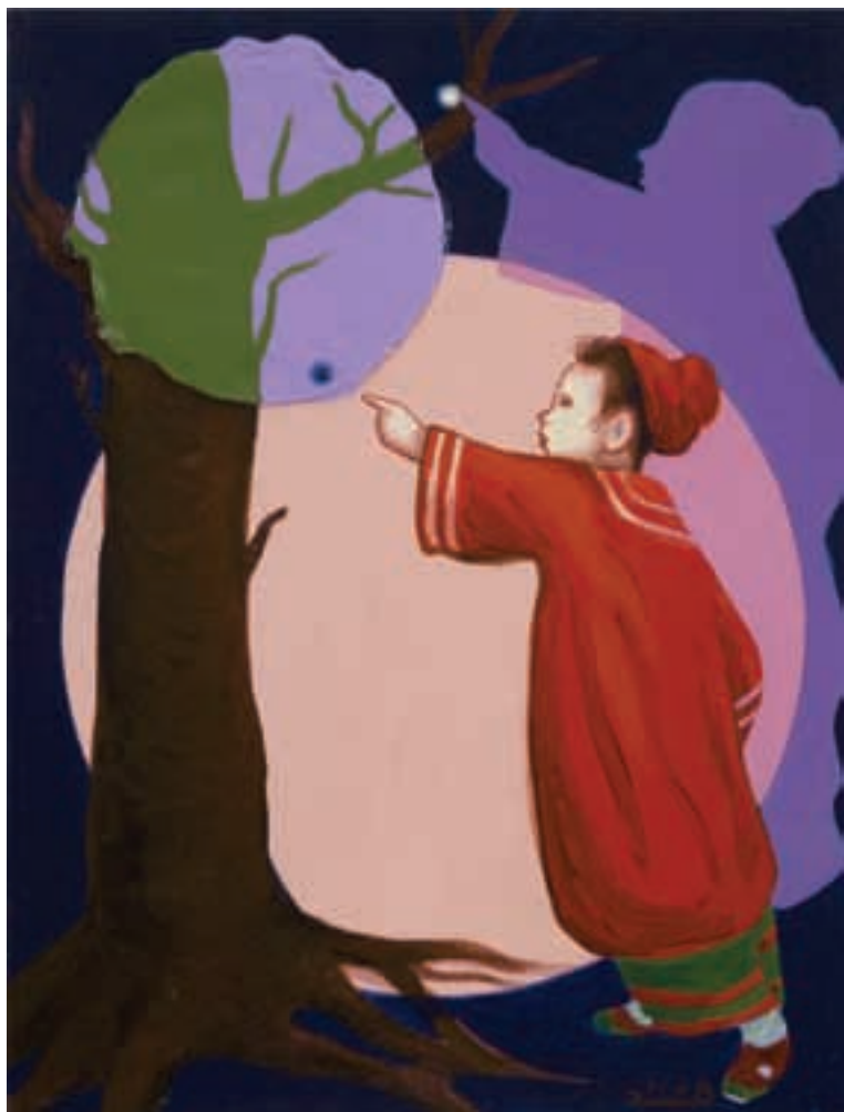
Sin título • CAT 15