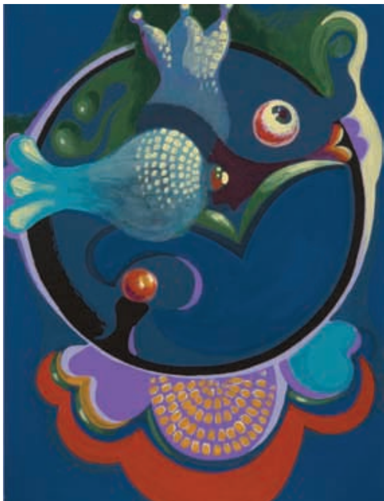
Sin título • CAT 13